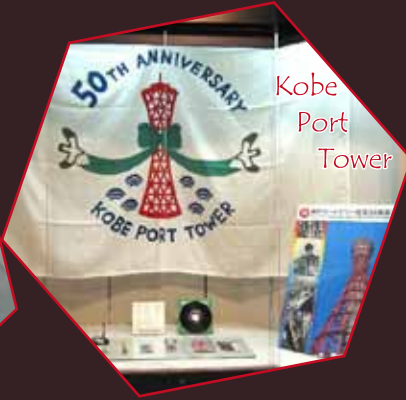
Kobe Port Tower