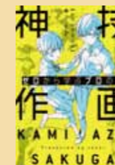
『ゼロから学ぶ プロの技 神技作画』