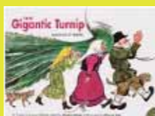
『The gigantic turnip』 Tolstoy's Russian folktale 有瀬館「催し物」 726.6/Gig