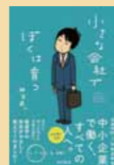
『小さな会社で ぼくは育つ』