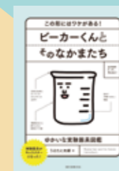
『ピーカーくんと そのなかまたち』