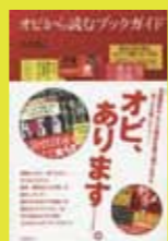
『オビから読むブックガイド』 竹内勝巳著 新館2階書籍テーマ展示 023.1/TAK/O