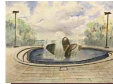
中央区港島中町8丁目 公園の噴水にあるスクリューは、1968年10月に建造され、北米航路に活躍した最初の船、コンテナ船あめりか丸のもの。