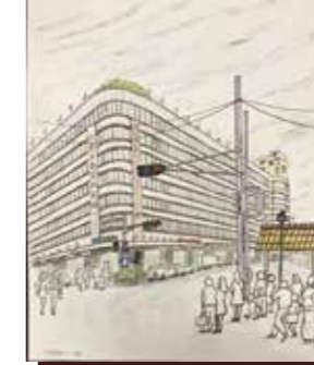
中央区明石町40番地 明治以前に創業。 1989年に国の重要文化財に指定された。