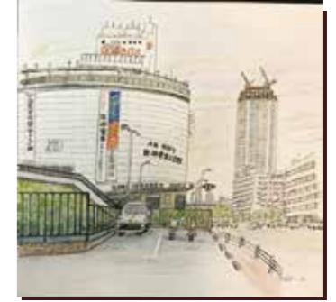
中央区小野柄通8丁目 1933年に開業。 1970年代以降、神戸で売上高「地域一番店」となった。