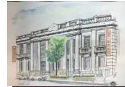
中央区栄町通3丁目 6本のイオニア式円柱が並ぶ、本格的な古典主義建築の傑作。