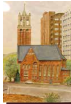
中央区下山手通4丁目 神戸の慰留地47番に1986年9月17日開設された、日本宣教部が起源。