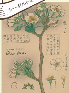
川原慶賀/画『草木花実写真図譜』